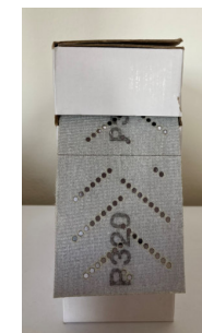
TL92V – Rotolo abrasivo a rete viola in ceramica